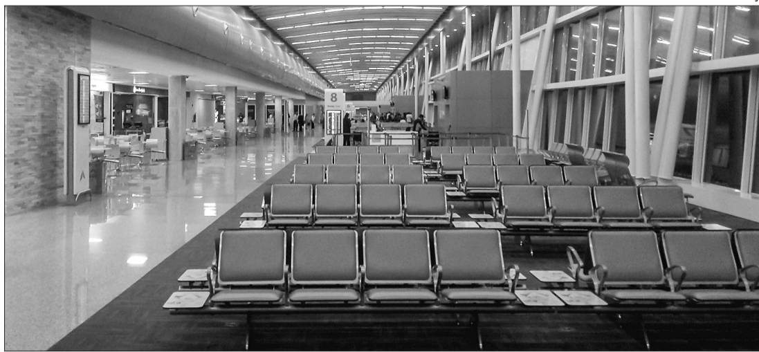
A realidade, nos aeroportos brasileiros, tem sido de baixa e a demora no retorno já preocupa

De acordo com o economista-chefe da Iata, Brian Pearce, o setor mostrou uma recuperação no número de voos (con-