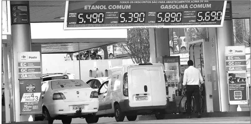
De abril a julho, segundo consultoria consultada pela TN, a redução no preço do litro da gasolina no Estado chegou a R$ 1,47

“Avaliamos de forma positiva esse primeiro mês de redução de impostos. Temos percebido incremento nas vendas, o pessoal voltando a abastecer. Aquele cliente que colocava R$ 50, ele continua colocando R$ 50, mas agora leva 5 litros, leva 6 agora, falando em números redondos. Isso acaba aumentando o número