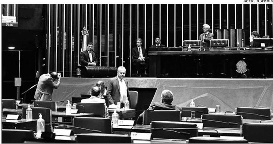
Sérgio Moro ficou surpreso que o Governo tenha ido para cima do Google que se opõe ao projeto

ná, Sérgio Moro disse que "agora, o que causa espécie é que o Governo vá para cima daquele que se opõe ao projeto - e vejam que aqui não estamos falando ainda de qualquer opositor, estamos falando de uma grande plataforma digital, um dos gigantes empresariais do mundo, e o Governo ainda assim vai para cima".