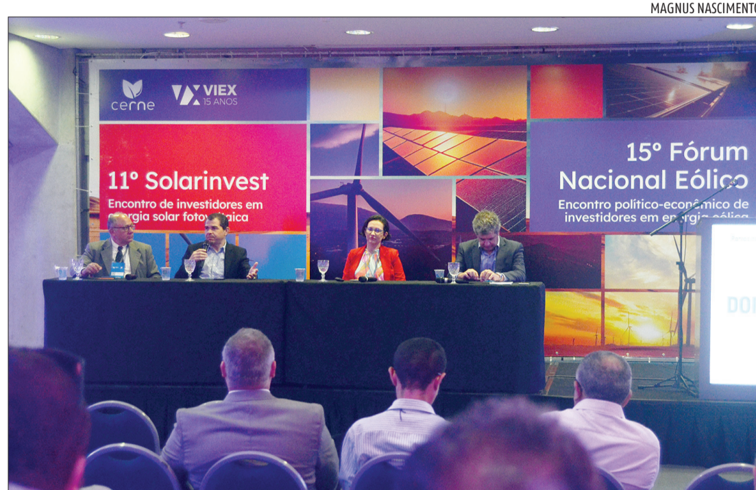
Dados e alternativas foram apresentados, ontem, no 11º Encontro de Investidores em Energia Solar

Segundo levantamento da Associação Potiguar de Energias Renováveis (APER-RN), as conexões de energia solar distribuída cresceram cerca de 107,9% em 2022 na comparação com 2021. O aumento é maior do que a média do Nordeste, que é de 96,7%; e do Brasil, 84,8%. Para que as metas sejam atingidas, a Sedec prevê a construção, operação, manutenção e gestão de miniusinas para abastecimento de prédios estaduais, em formato de Parceria Público-Privada. Dessa maneira, as miniusinas devem reduzir em 35% gastos do Estado com energia. A estratégia é parte do Programa Estadual de Autossuficiência Energética, em desenvolvimento a partir deste ano.