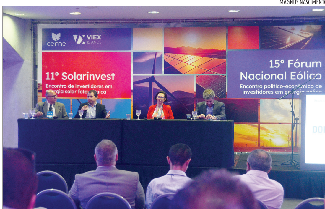
Dados e alternativas foram apresentados, ontem, no 11º Encontro de Investidores em Energia Solar

Segundo levantamento da Associação Potiguar de Energias Renováveis (APER-RN), as conexões de energia solar distribuída cresceram cerca de 107,9% em 2022 na comparação com 2021. O aumento é maior do que a média do Nordeste, que é de 96,7%; e do Brasil, 84,8%. Para que as metas sejam atingidas, a Sedec prevê a construção, operação, manutenção e gestão de miniusinas para abastecimento de prédios estaduais, em formato de Parceria Público-Privada. Dessa maneira, as miniusinas devem reduzir em 35% gastos do Estado com energia. A estratégia é parte do Programa Estadual de Autossuficiência Energética, em desenvolvimento a partir deste ano.