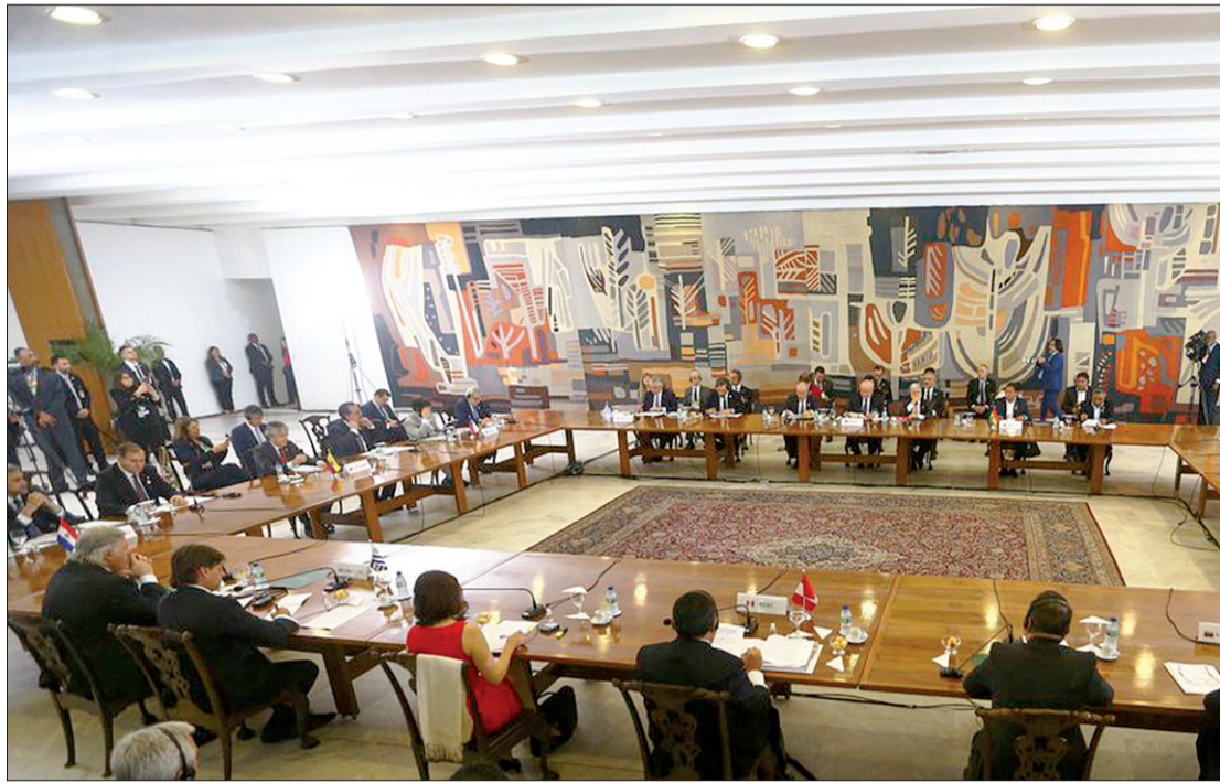
Lula sugeriu a criação da moeda comum durante cúpula de países sul-americanos nesta terça-feira