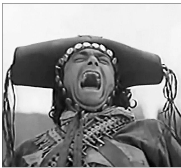
Curta metragem de 20 minutos se inspirou a “Invenção do NE”