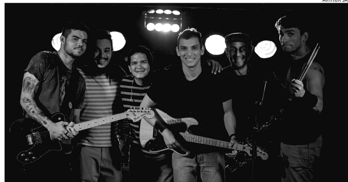
A Desventura foi criada em 2006, desde sempre apostando em tocar versões dos Los Hermanos

A banda Desventura foi criada em 2006, desde sempre apos-