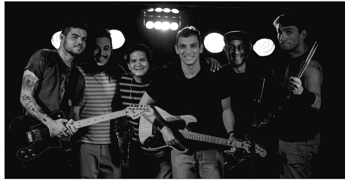
A Desventura foi criada em 2006, desde sempre apostando em tocar versões dos Los Hermanos

A banda Desventura foi criada em 2006, desde sempre apos-