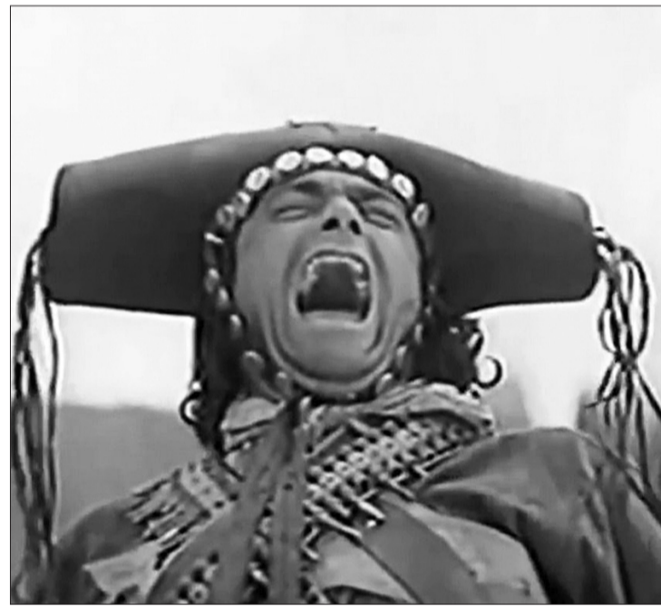
Curta metragem de 20 minutos se inspirou a “Invenção do NE”