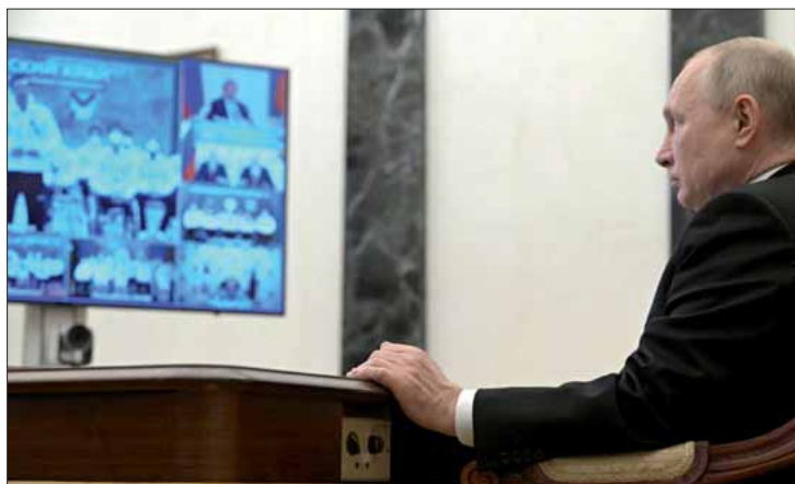
Putin prometeu enviar "tropas de paz" a Donetsk e Luhansk

Em uma série de declarações, o líder russo afirmou que os acordos de Minsk, negociados entre 2014 e 2015 para encerrar as hostilidades entre o governo ucraniano e os separatistas do leste do país, "já não existem", disse estar pronto para discutir a desmilitarização da Ucrânia e argumentou que a "melhor solução" para acabar com a crise envolvendo o país seria a desistência do plano