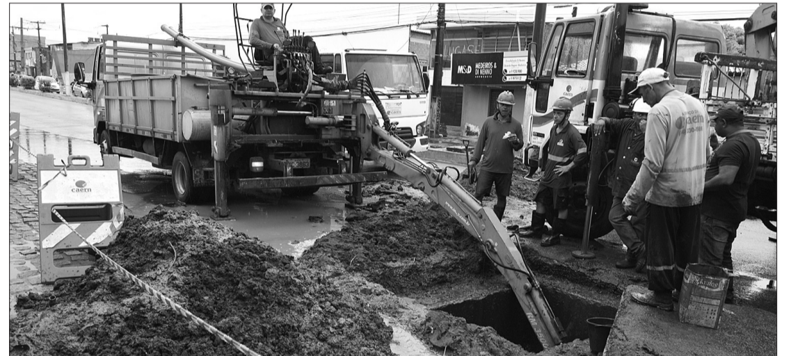
Na avenida João Medeiros Filho, Zona Norte, homens trabalharam limpando as galerias pluviais

Entre os reservatórios sob responsabilidade da Semov, 23 são tidos como prioritários em ação civil pública movida pelo Ministério Público do RN que visa manter o sistema funcionando.