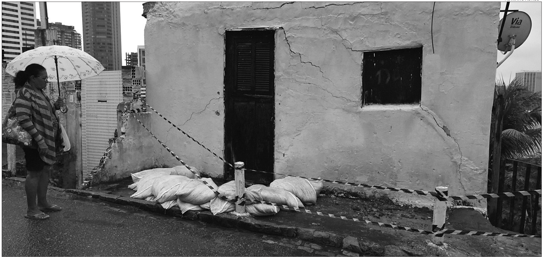
Na comunidade do Jacó, Zona Leste da cidade, o risco de desabamento aumentou nos últimos dias e a Defesa Civil trabalha para evitar maiores danos na área

Do outro lado, na rua Virgíniópolis, em Nova Parnamirim, moradores de um condomínio fechado ficaram "ilhados" e ambulâncias da SAMU presas no alagamento. Os moradores explicaram que o problema ocorre há anos, e que mesmo buscando ajuda da prefeitura de Parnamirim, nada é feito. "Aqui é a mesma dor de cabeça sempre que chove. Estamos cansados de ver o problema se repetir e nada ser feito", reclamou a