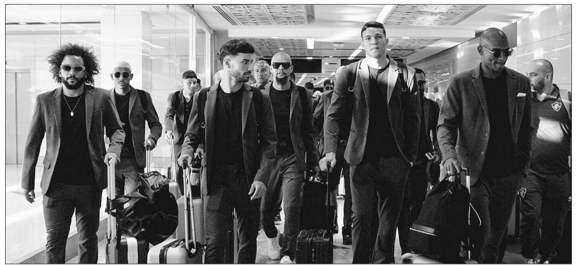
Após a chegada na Arábia Saudita, o Flu se hospedou e em seguida realizou um treino na academia

O time treinará no mesmo horário na sexta, no sábado e no domingo. Na segunda, às 15 horas (de Brasília), o Flu estreará no Mundial, diretamente na semifinal, contra o vencedor do duelo entre Al-Ittihad e Al-Ahly, que vão jogar na sexta-feira.