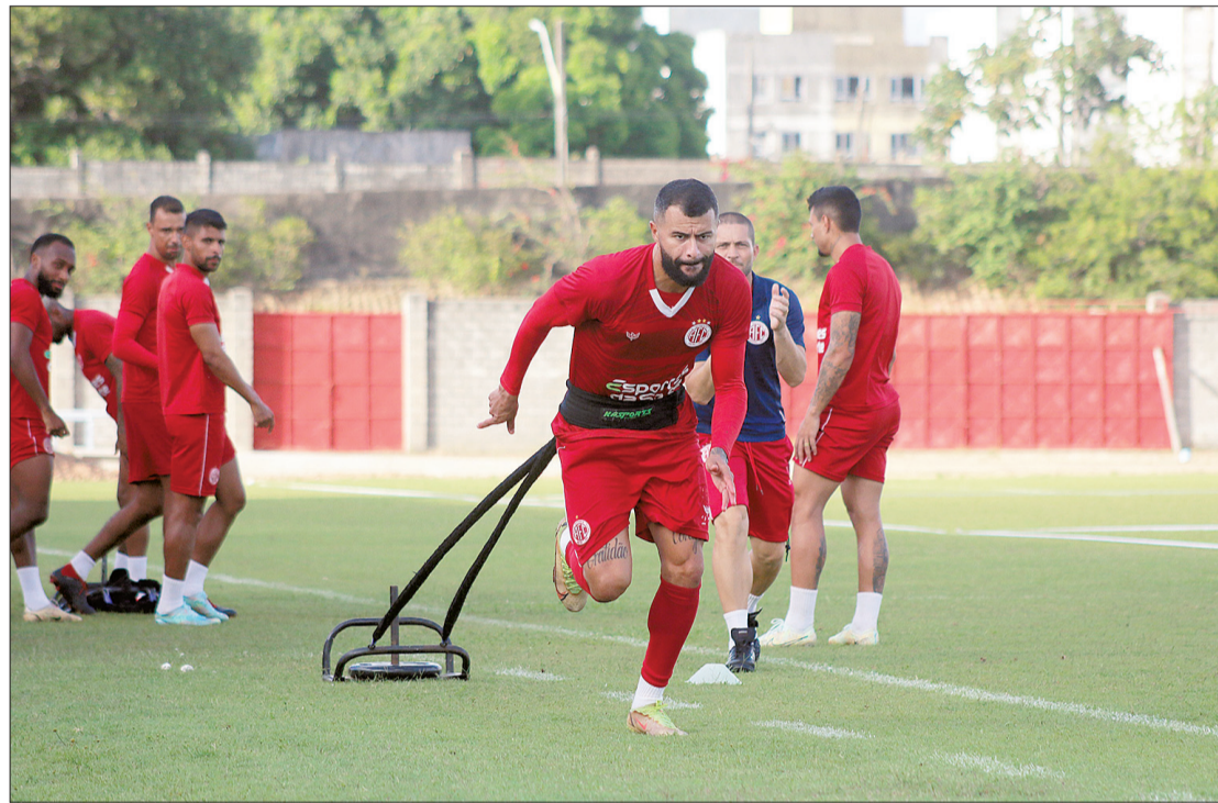
O América está em fase final de preparação para a temporada 2024 e realizará outro amistoso