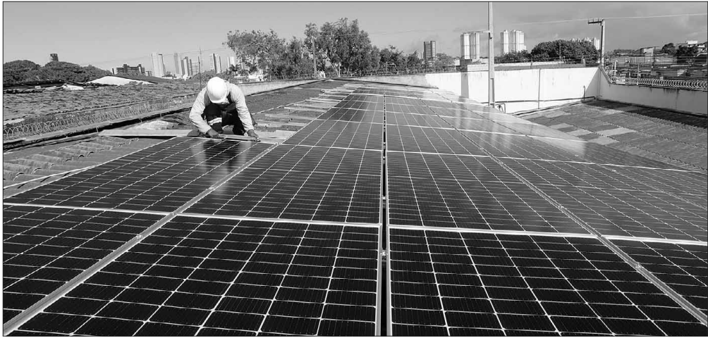
Este ano, até o início de novembro, segundo dados da Absolar, a energia solar cresceu 59,4%, com a potência instalada saltando de 13,8 gigawatts para 22 gigawatts

“Nos últimos 150 dias, o ritmo de crescimento tem sido de praticamente 1 GW por mês, o que coloca a fonte na terceira posição da matriz elétrica brasileira”, informou a Absolar. O crescimento, porém, vem sendo impulsionado pela geração própria de energia. São praticamente 15 GW de potência instalada da fonte solar, o que equivale a investimentos de cerca de R$ 82,9 bilhões desde 2012, quando essa energia começou a crescer no País. Já a fonte solar centralizada, representada por grandes projetos adquiridos em leilão de energia do governo, somam 7