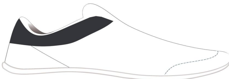
FIGURA: ESPUMA DO COLARINHO

ESPUMA DO COLARINHO - Na região superior da parte traseira do cabedal deverá ser utilizada uma espuma de colarinho para promover o acolchoamento desta região, trazendo uma maior percepção de conforto ao usuário. Esta Espuma deverá ser em poliuretano expandido, com espessura mínima de 8 mm e densidade mínima de 20 Kg/m 3 na (Traseira). Ver na figura abaixo desenho e posição da espuma.