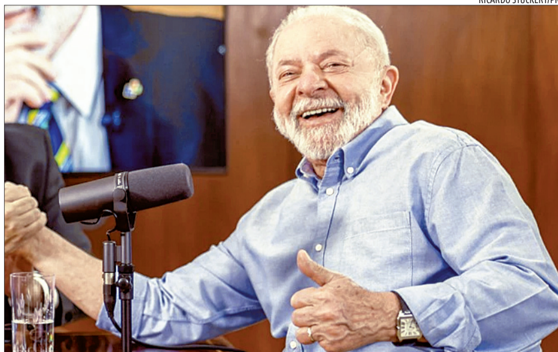
Presidente da República, Lula da Silva, usa relógio Cartier de R$ 60 mil durante live no Planalto