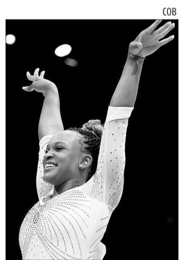
Rebeca Andrade, ginasta

Por outro lado, o Goiás busca aproveitar o momento ruim do seu adversário para se distanciar da zona de rebaixamento. Após conquistar quatro pontos dos últimos seis disputados, o Esmeraldino tem a chance de ultrapassar o Corinthians na classificação em caso de um triunfo fora de casa.